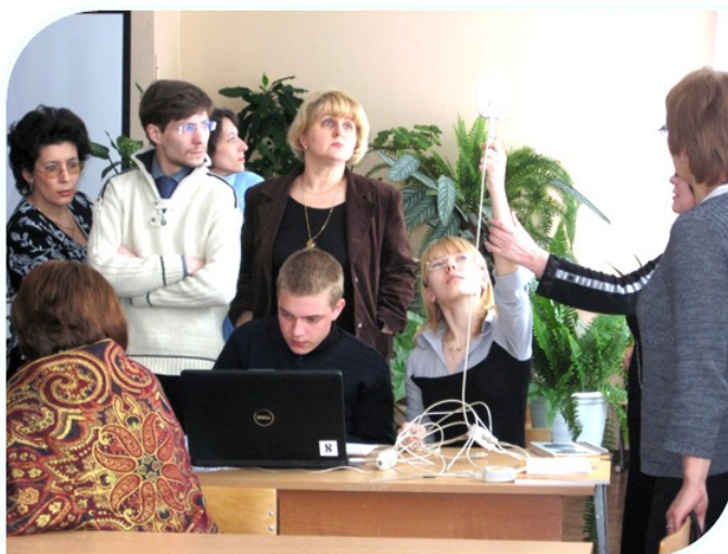
Делаются точные замеры

рированное занятие спецкурсов по информатике и МХК «Живите в доме—и не рухнет дом», интегрированный урок-исследование по химии,