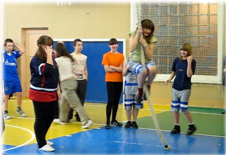
На «маянике» 7 класс