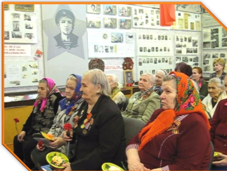
Почётные гости школы

10 апреля школа торжественно встречала почётных гостей—ветеранов Великой Отечественной войны, тружеников тыла, несовершеннолетних узников концлагерей и тех, кто перенёс блокаду. В этот день в историко-краеведческом музее состоялась церемония вручения юби-