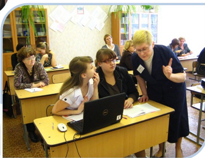
Спецкурс по русскому языку

права», а также внеклассное мероприятие в рамках декады естественных наук «Последний герой», на которой были подведены итоги интеллектуального марафона среди обучающихся 7—11 классов.