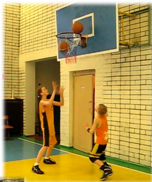
Чей мяч в корзине?!