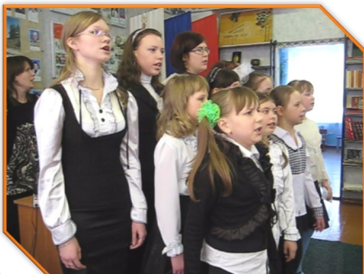
“Пусть всегда будет мама,” - поют дети и все присутствующие