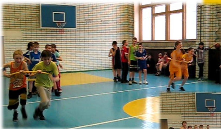
Соревнуются 5 и 6 классы