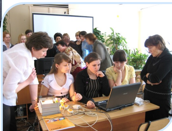
Работа с датчиками в цифровой лаборатории

биологии, физике «Методы познания», элективный курс «Основы