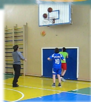
В борьбу вступили ученики 7—9 классов