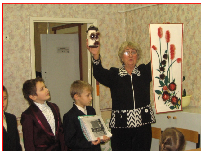
Подарок от 2а класса