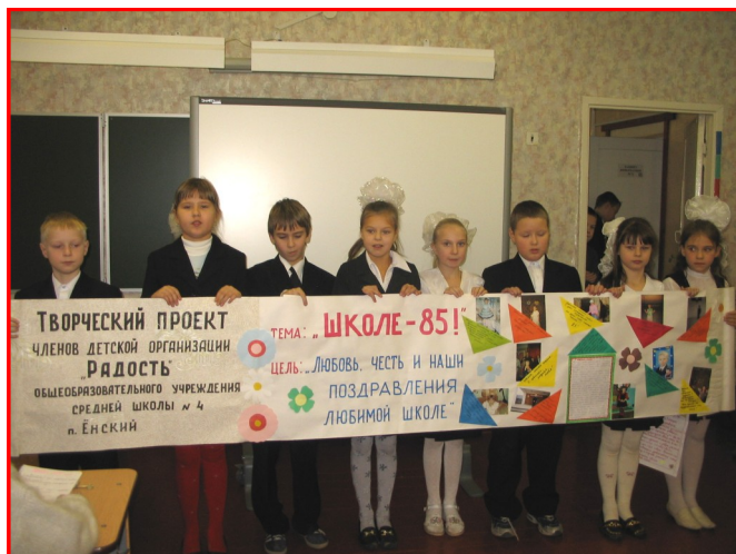
«Защитается» 3 класс

Накануне юбилея школы каждый класс готовил проект «Школе - 85». Ребята представили интересные презентации, творческие работы, альбомы с фотографиями и рисунками, даже панно. Уверенно, артистично защищали свои проекты учащиеся начальных классов. А вот старшеклассникам надо поучиться у малышек.