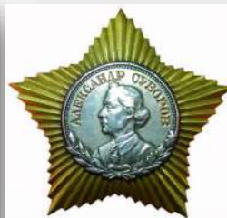
Орден Александра Суворова