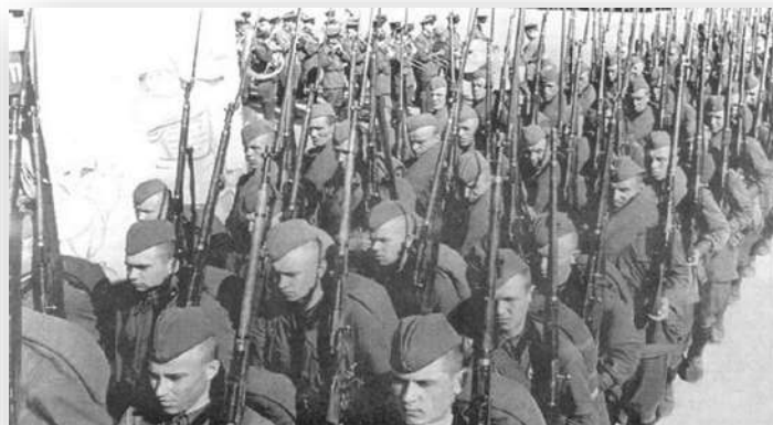
Великая Отечественная война