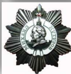
Орден Михаила Кутузова