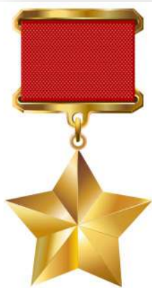
Медаль Героя Советского Союза

За всю историю существования СССР звания Героя Советского Союза были удостоены 12777 человек (без учёта 72 лишённых звания за порочащие поступки и 13 человек, указы по которым отменены как необоснованные), в том числе дважды — 154 ( девять — посмертно) человека, трижды — три человека и четырежды — двое .