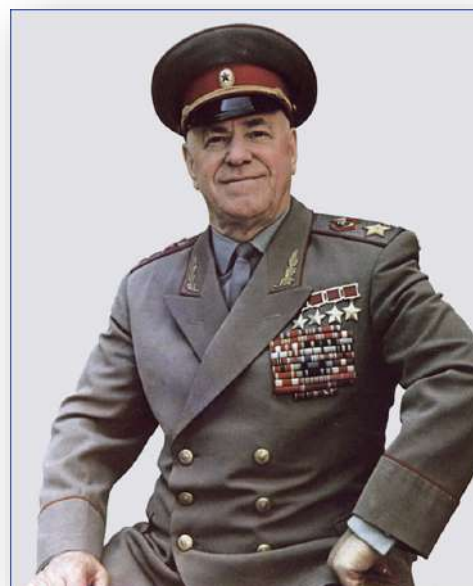
Маршал К.Г. Жуков

За всю историю существования СССР звания Героя Советского Союза были удостоены 12777 человек (без учёта 72 лишённых звания за порочащие поступки и 13 человек, указы по которым отменены как необоснованные), в том числе дважды — 154 ( девять — посмертно) человека, трижды — три человека и четырежды — двое .