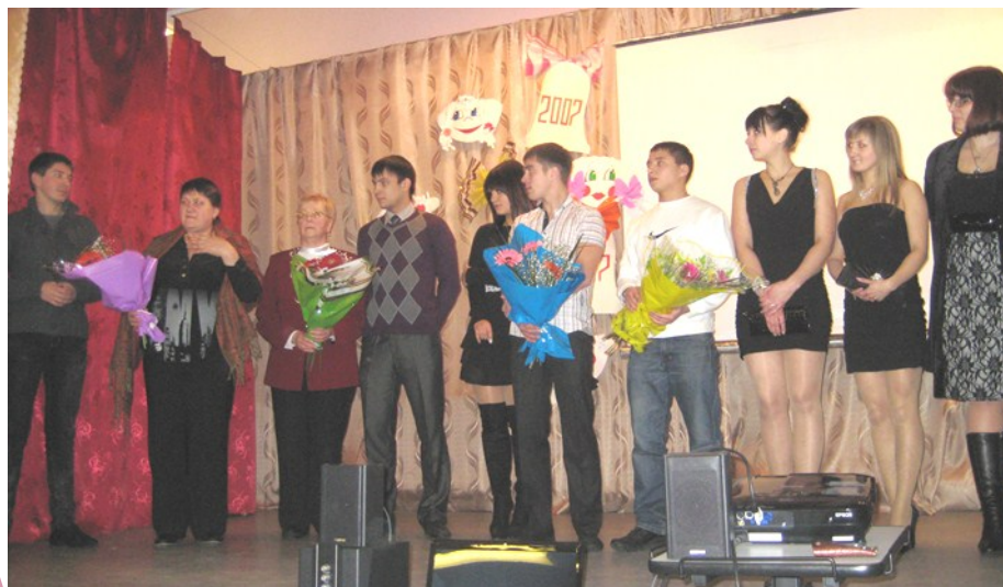
Самые юные выпускники—пятилетние

К сожалению, не присутствовали выпускники 2002 года, десятилетние. Очевидно, в самом начале после учебы и первых лет работы у кого-то молодая семья, у кого-то карьерный рост, у кого-то "своё дело открылось".