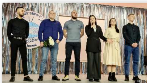
Выпускники 2013 года