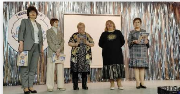
Выпускники 1978 года

Ученики школы подготовили выпускникам и учителям интересные художественные номера. По счастливым лицам выпускников можно было догадаться, что они снова там, в далеком, безоблачном и таком счастливым детстве!