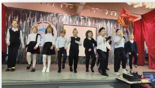
О прадедушке поёт 3-ий класс

Зрители с нетерпением ждали каждое очередное выступление и бурными аплодисментами поддерживали юных артистов.