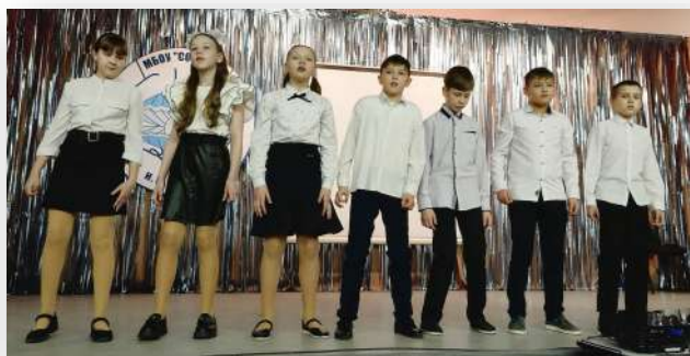
Звучит песня в исполнении учеников 4 класса

Ученики школы подготовили выпускникам и учителям интересные художественные номера. По счастливым лицам выпускников можно было догадаться, что они снова там, в далеком, безоблачном и таком счастливым детстве!