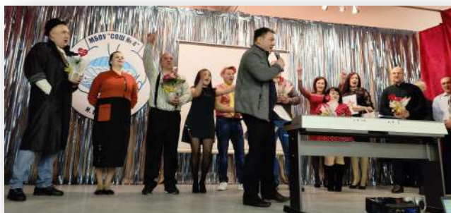
Выпускники 1998 года