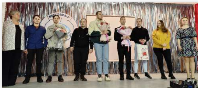
Выпускники 2018 года

Героями вечера были выпускники 2018, 2013, 1998, 1993, 1988, 1978 годов, приехавшие из разных уголков нашей страны. С огромным удовольствием вспоминают они детство, окунаются в атмосферу веселья и беззаботности.