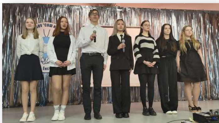
«Не плачь, девчонка!» - на сцене 9-ый класс