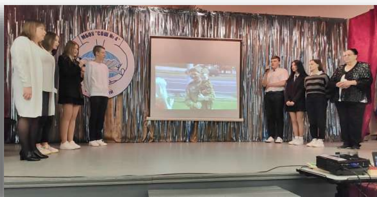
«И всё о той весне» - поют старшеклассники