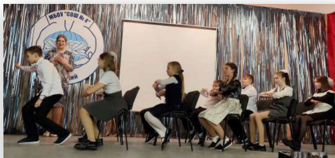
О чём мечтает учитель?..