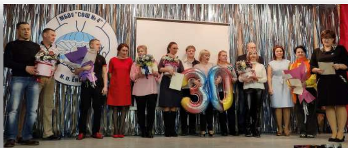
Выпускники 1993 года