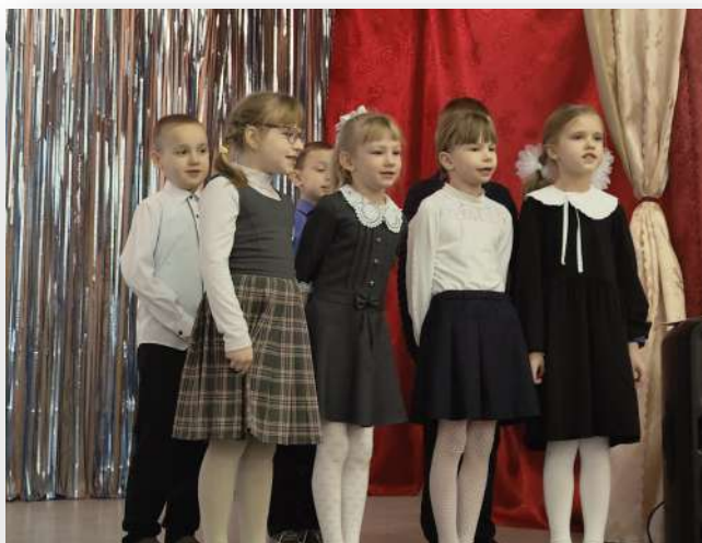
Первоклассники исполняют «Катюшу»

В фестивале приняли участие песенные коллективы 1 – 6, 8 – 11 классов, а также вокалисты сельского Дома культуры. Были исполнены песни советских и российских композиторов: лирические и патриотические, задорные и веселые, и в каждой из них звучала гордость и глубокое уважение к солдату.