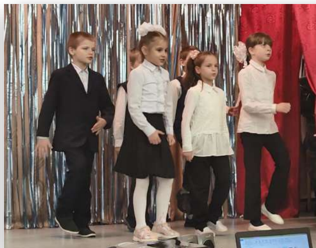
О храбрых солдатах поют второклассники

Зрители с нетерпением ждали каждое очередное выступление и бурными аплодисментами поддерживали юных артистов.