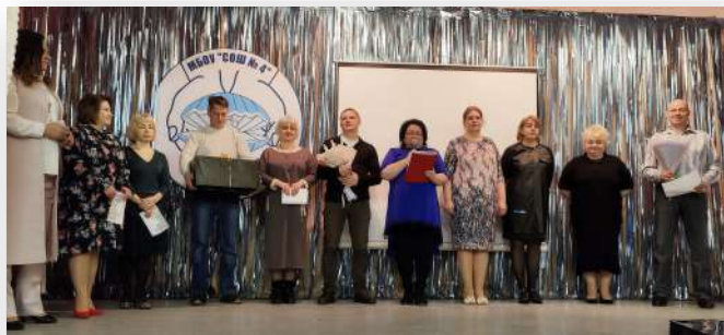
Выпускники 1988 года