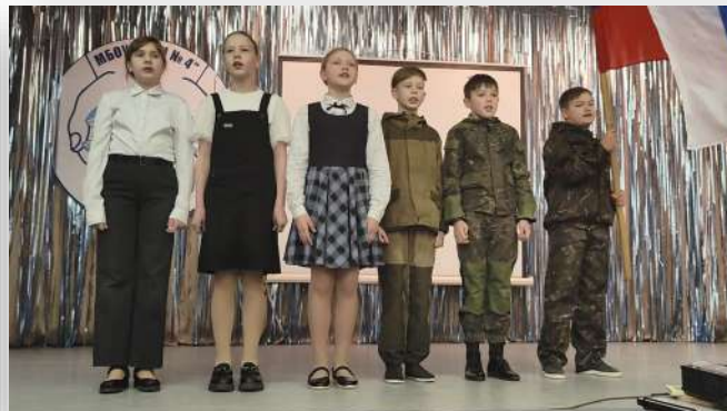
4-ый класс с песней «Русских не победить!»